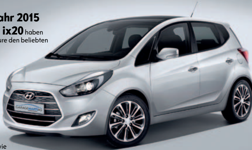
Hyundai ix20 Origo Barverkaufspreis ab netto CHF 17'490.- Leasing (Aktionsleasing 3.9%) ab CHF 136.-/Mt.

Tugenden, welche die ix20-Fahrer schätzen, wurden beim Facelifting beibehalten. Die erhöhte Sitzposition oder die geräumigen Platzverhältnisse gehören genauso dazu wie der angenehme Fahrkomfort. Ergänzt wurden diese Eigenschaften mit einem neuen Design, einer 6-Stufen-Automatik, LED-Heckleuchten oder neuen bi-funktionalen Projektionsscheinwerfern.