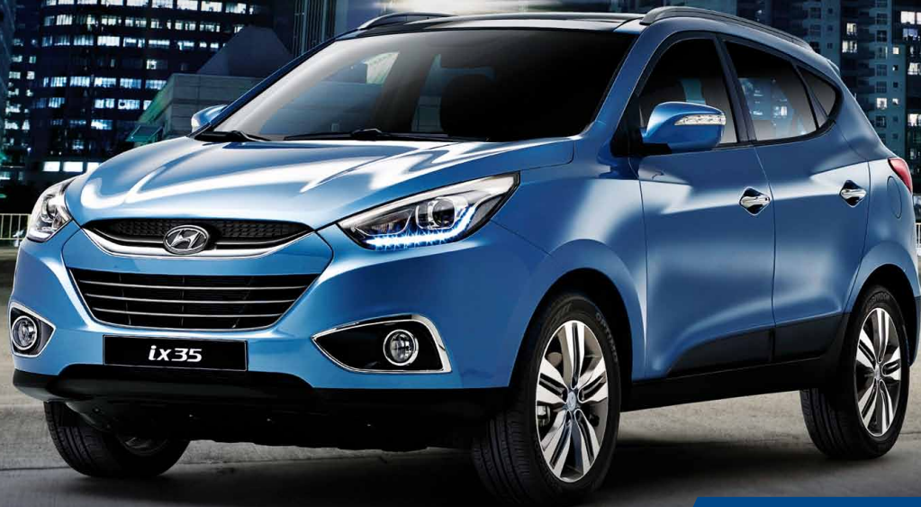
Hyundai ix35 Comfort 1.6 135 PS 2WD ab Fr. 23'990.– Leasing ab Fr. 347.75 / Monat

zur echten Ausnahmeerscheinung unter den Kompakt-SUVs. In der neuen Version ist er zudem mit Bi-Xenon-Scheinwerfern, LED-Tagfahrlicht und LED-Rücklichteinheiten ausgestattet.