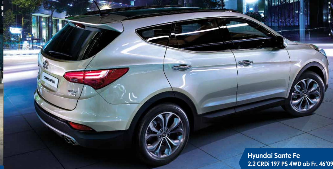
Hyundai Sante Fe 2.2 CRDi 197 PS 4WD ab Fr. 46'090.– Leasing ab Fr. 666.35 / Monat

Weil zum Vorausfahren in der heutigen Zeit vor allem auch mehr Effizienz gehört, können Sie sich auf niedrige Verbrauchs- und Emissionswerte freuen. Der moderne 2.2 CRDi Turbodieselmotor leistet 197 PS und beeindruckende 436 Nm Drehmoment. Sie haben die Wahl zwischen einem sportlichen 6-Gang Handschaltgetriebe oder einem komfortablen 6-Stufen Automatikgetriebe.