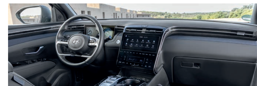
Digitale 10.25"-Instrumenteneinheit und Touchscreen-Konsole