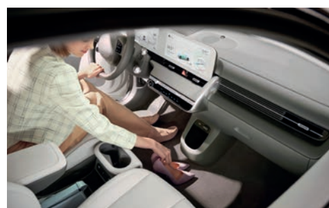
Electric-Global Modular Plattform (E-GMP)