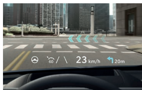
Augment-Reality Head-up Display

Eine Innovation, auf die ich nicht mehr verzichten möchte, ist das Steuern der Standheizung und Kühlung über die Bluelink-App auf dem Smartphone. Ist doch wunderbar, in ein wohl temperiertes Auto zu steigen.»