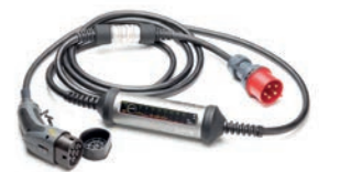
JUICE BOOSTER 2